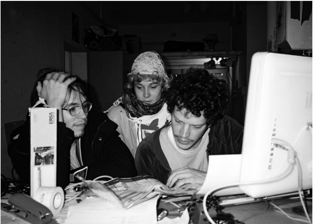
Ausnahmestand und Alltag in der Ausleihe | Work and play in the Equipment Loans